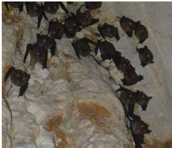
Slika 44: Kolonija netopirjev med počivanjem oz. mirovanjem.

A colony of bats resting or hibernating.