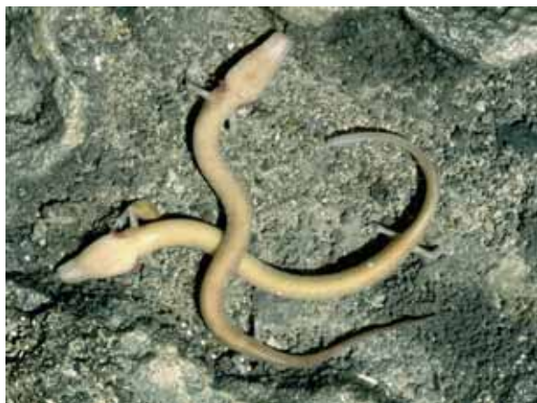
Slika 45: Človeška ribica Proteus anguinus anguinus.

Proteus anguinus anguinus.